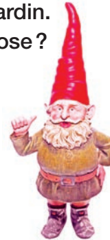
nain de jardin