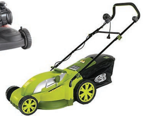
E tondeuse électrique