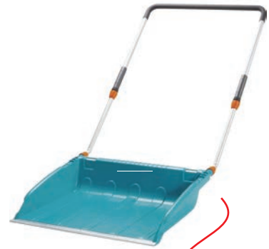
C le traîneau à neige

3 Qu'ont en commun les chaussettes (les bas), la tuque, le foulard et les mitaines ?