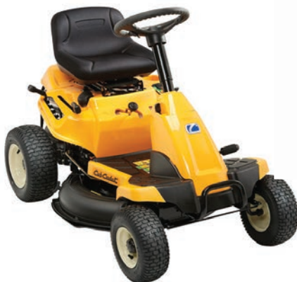
C tondeuse autoportée