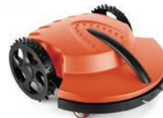
D tondeuse robot