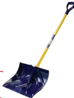
B la pelle à neige