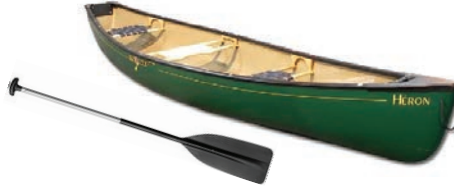
B un canot à aviron