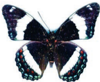
papillon amiral-blanc insecte emblème du Québec

boule à trois trous, pour les doigts, et jeu de cinq grosses quilles