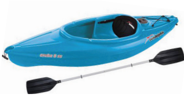
A un kayak à pagaie

1 Quel type d'embarcation possède le chroniqueur ?