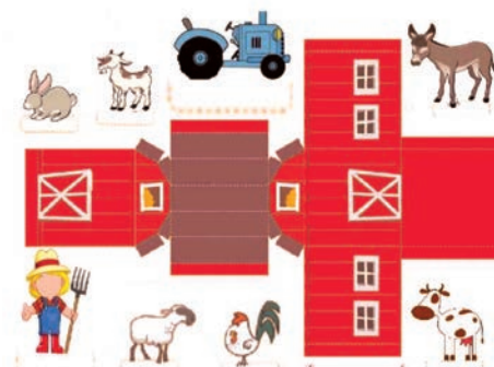
ferme de papier à découper et assembler, tout comme les chapitres d'un livre

5 En quoi l'expression « faire un travail de défrichage » est-elle une analogie littéraire ?