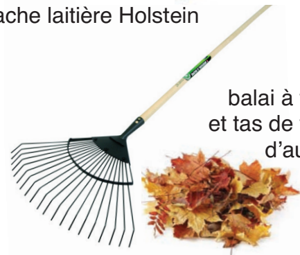
balai à feuilles et tas de feuilles d'automne

3 Le chroniqueur examine ses mains. En quoi ont-elles changé ?