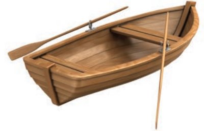
C une chaloupe à rames

2 En quelle saison se déroule l'histoire vécue par le chroniqueur ?