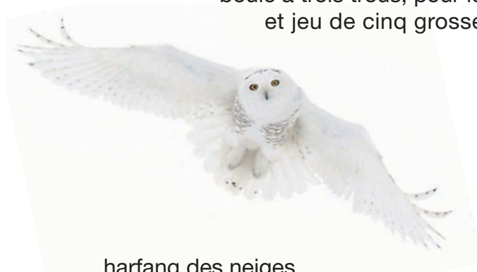
harfang des neiges emblème aviaire du Québec